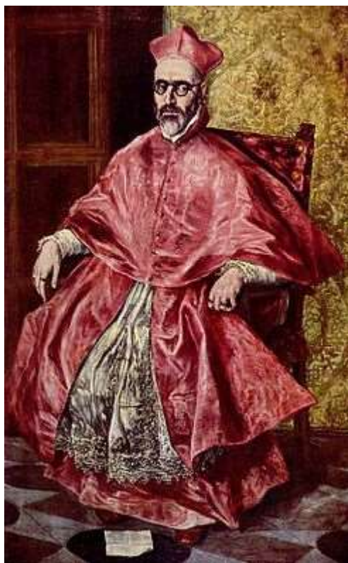
Retrato del Greco de Fernando Niño de Guevara, arzobispo de Sevilla e Inquisidor General de España.