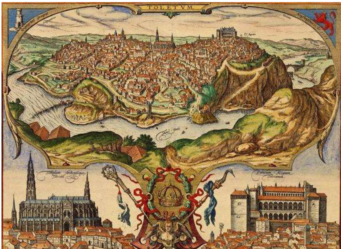
Grabado de Toledo en el siglo XVI, realizado sobre dibujo de Joris Hoefnagel, época en que la ciudad acogió una destacada colonia francesa.