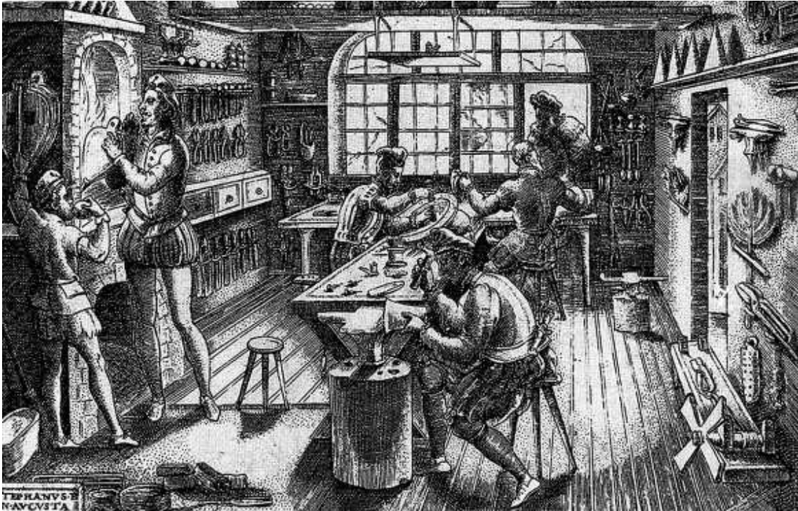
Talleres de platería, según grabados de Étienne Delaune (Augsburgo, 1576)