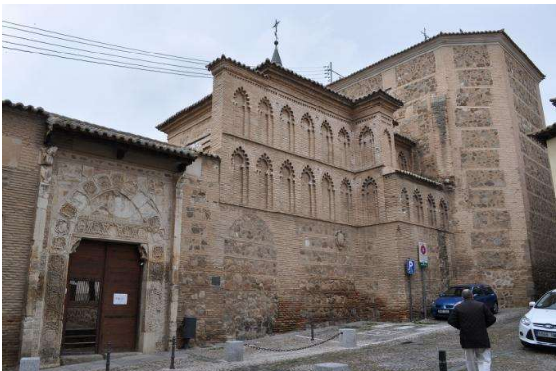
Convento de Santa Isabel de los Reyes (Toledo).

vecino de Toledo, en su testamento realizado en Madrid, el día 29 de abril de 1634 acrecentó estas capellanías 64 .