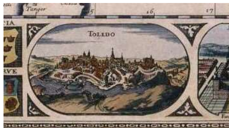
Detalle del Mapa: Newly described, with many adictions, both in the attires of the people & the situations of their cheifest cities by John Speed. (1623)

Curiosamente, posteriormente, el alcalde mayor el licenciado Jerónimo de Rueda, el 20 de junio de 1582, intervendrá en el expediente abierto e informativo sobre una vacante de escribano en la ceca de Toledo, que ocupará Esteban de Garibay (1533-1599) 6 . Aparte, también interviene en casos de esclavitud de moriscas, como es el caso de Lorenza, que se querelló a través de su curador Juan de Monroy contra el jurado Diego López de Herrera (1571) 7 .