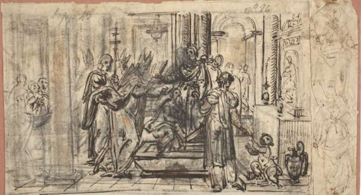
San Ildefonso y Recesvinto en la tumba de Santa Leocadia / Dos figuras de santos en pie. Eugenio Caxés. Siglo XVII. Lápiz, Pluma sobre papel verjurado, ahuesado, 172 x 288 mm. No expuesto. Museo del Prado.