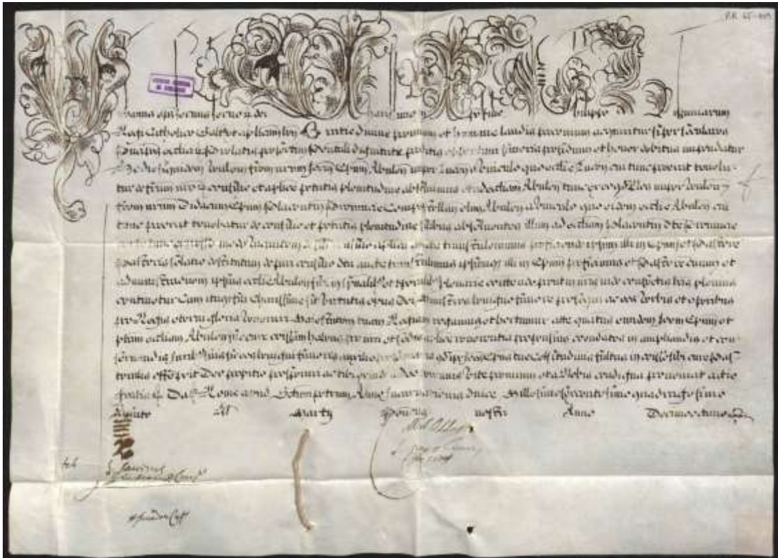
Bula de Urbano VIII a Felipe IV comunicando el nombramiento de Juan Vélez de Valdivieso, Obispo de Lugo, como Obispo de Ávila 17 .

El 6 de octubre de 1644 asiste a las exequias de Isabel de Borbón, muerta en el Palacio Real de Madrid, donde se encontró con el anterior obispo de Ávila, y testamentario de la Reina, Diego de Arce Reinoso 18 . Entre el 17 y 18 de noviembre se celebran sus honras por orden de Felipe IV en el convento Real de San Jerónimo de Madrid, asistiendo el obispo de Ávila.