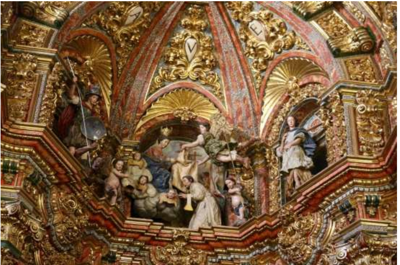
Imposición de la casulla a San Ildefonso. Iglesia de San Ildefonso de Granada.