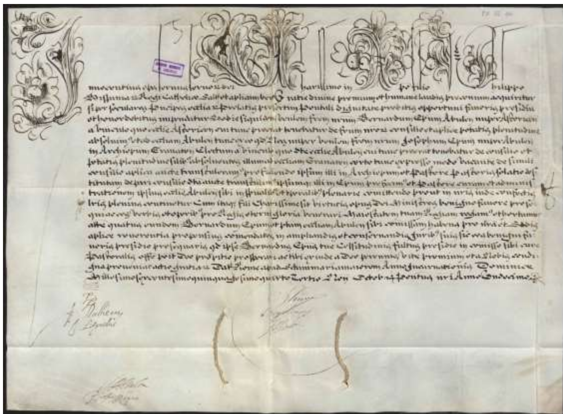
Bula de Inocencio X a Felipe IV comunicando el nombramiento Bernardo de Ataide, Obispo de Astorga, como Obispo de Ávila.

Posteriormente, a causa de su mala salud, Felipe IV le promociona el 4 de mayo de 1654 a la diócesis de Ávila, ratificándolo el 5 de octubre de 1654 el papa Inocencio X 2 .