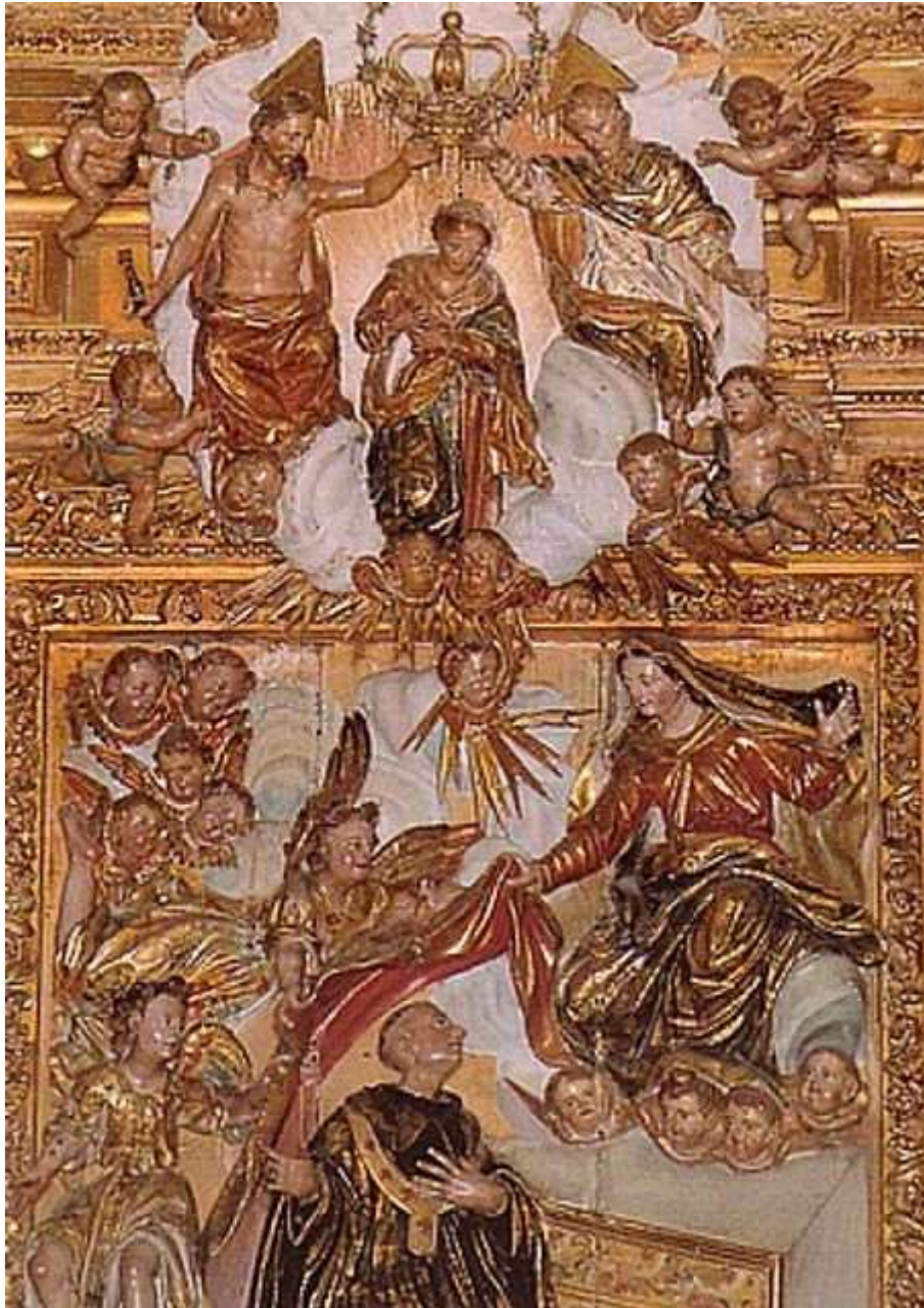
Imposición de la casulla de san Ildefonso. Detalle del Retablo de la Virgen. Iglesia de San Martín Pinario. Santiago de Compostela.