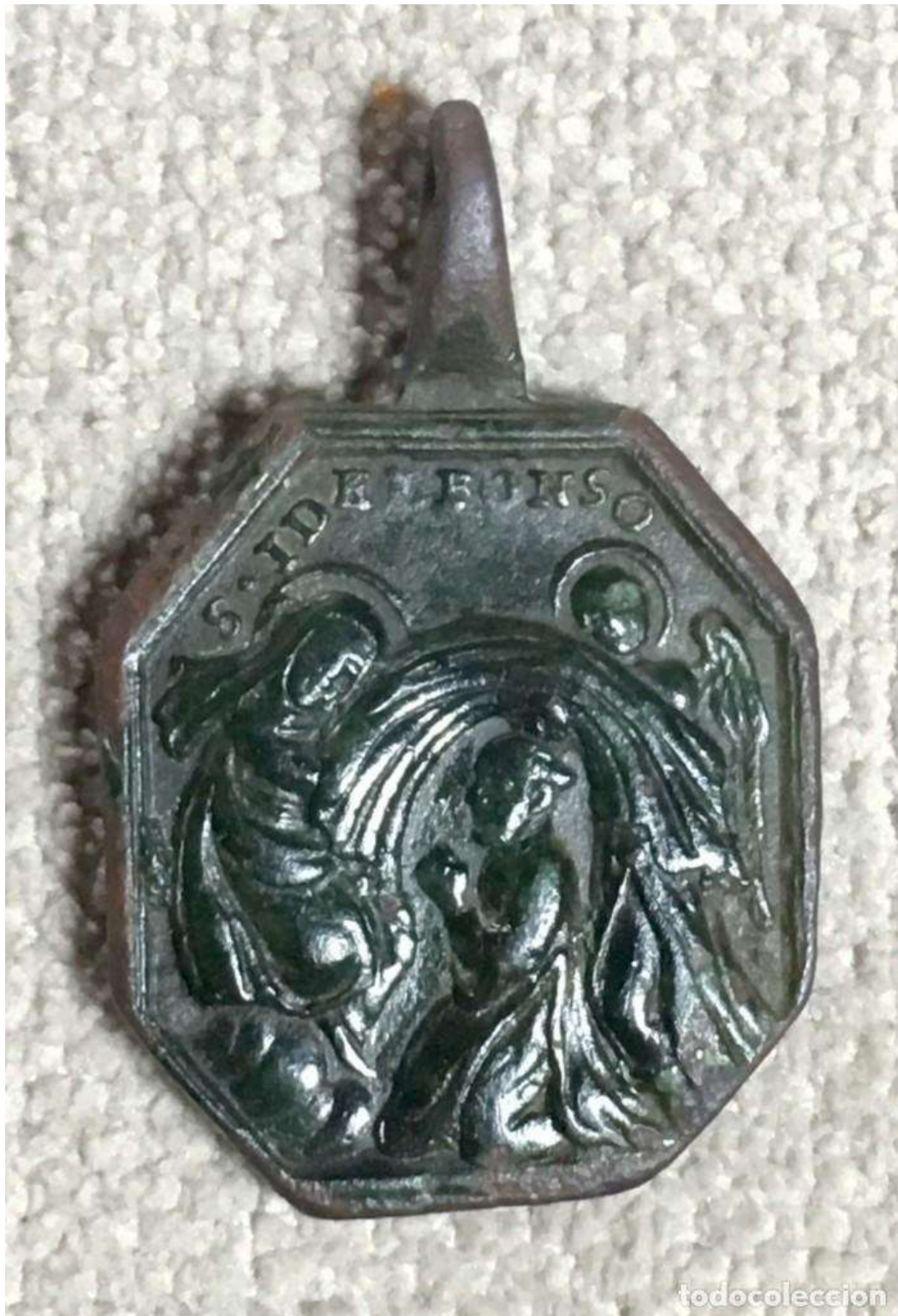
Medalla con la Imposición de la casulla a San Ildefonso. Siglo XVII.