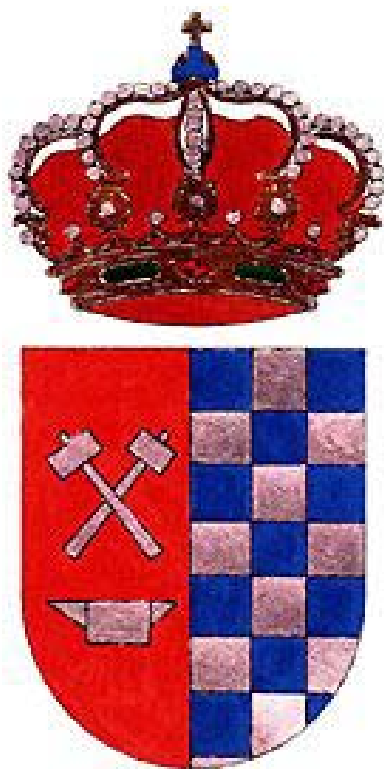
Escudo de la villa de Herreruela

Colección diplomática de Herreruela (Siglos XVI-XIX)